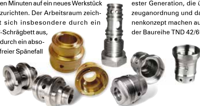
Teilespektrum aus allen Branchen